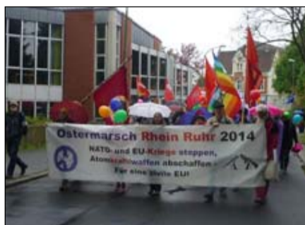
Der Marsch von Bochum-Werne nach Dortmund am 21. April