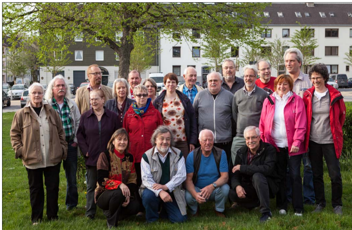
Einige der Kandidatinnen und Kandidaten der Sozialen Liste