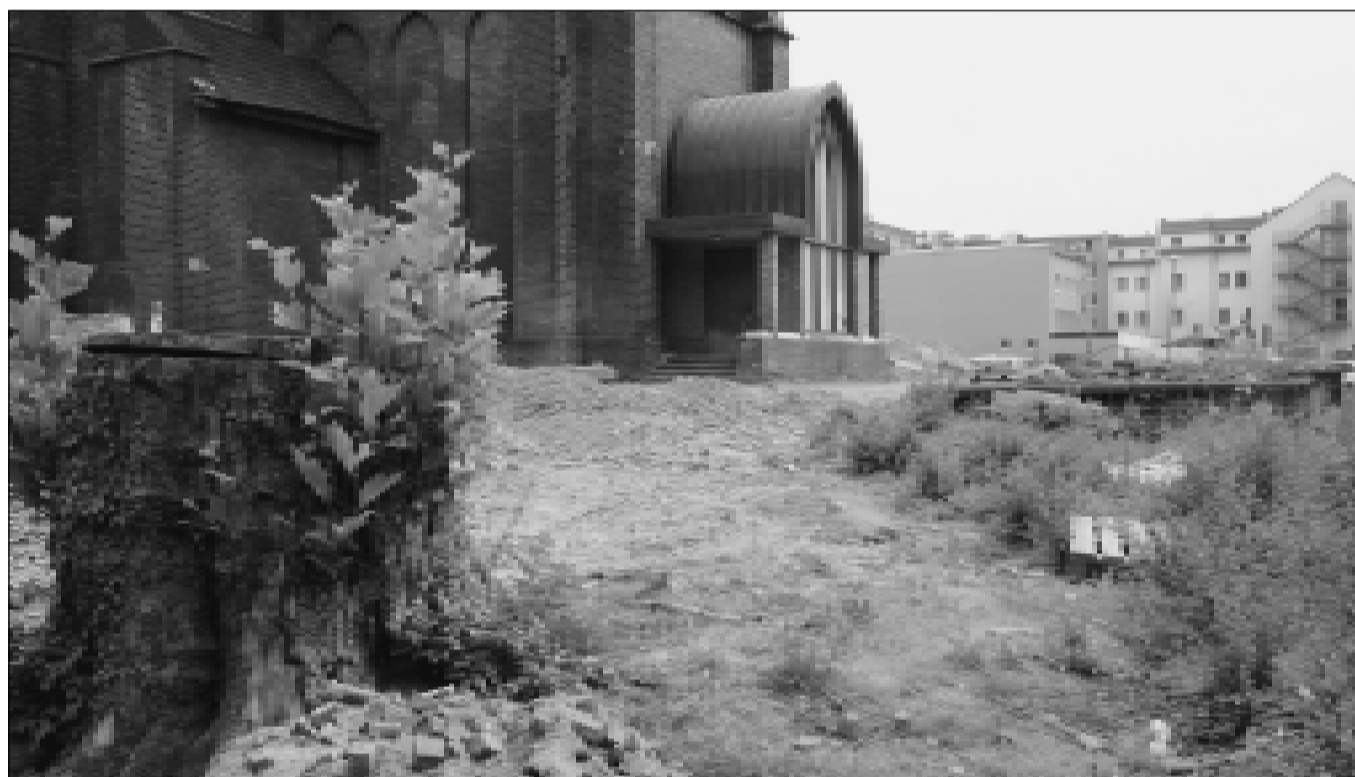
Sommer 2013: Der Bauplatz für das heftig umstrittene Konzerthaus an der Marienkirche