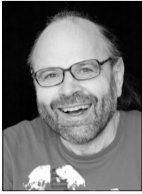
von Ulrich Achenbach

In Wietze bei Celle (Niedersachsen) wurde vor kurzem der größte Schlachthof Deutschlands für Hühner und Hähnchen eröffnet, wo jährlich mehrere Millionen Tiere sterben. Der Betreiberkonzern Rothkötter fordert für die volle Auslastung des Schlachthofbetriebes den Bau von 200 Megaställen (übersetzt: Tierquälanstalten) und setzt damit alle Bauern, die noch artgerechte Tierhaltung haben, unter großem Druck.