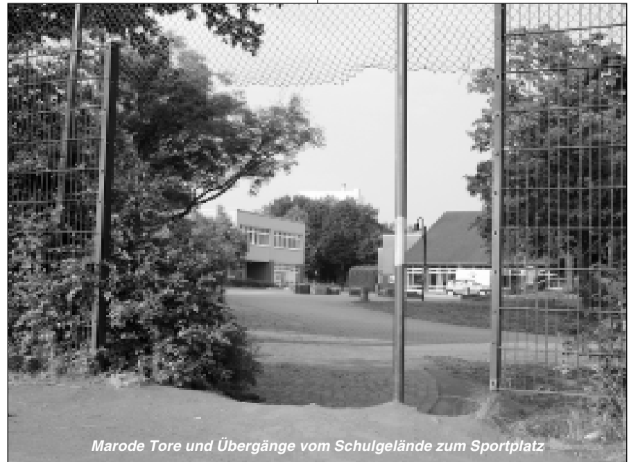
Marode Tore und Übergänge vom Schulgelände zum Sportplatz