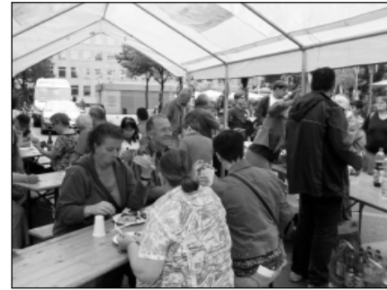
Bei gutem Wetter verweilten viele Passant_innen bei Getränken und Kuchen, Salaten und Würstchen vom Grill.

Danach folgte der Höhepunkt des Kulturprogramms. Ein Sketch zur aktuellen Situation beim JobCenter Bochum-Mitte sorgte für allgemeine Heiterkeit. Es wurde in satirischer Form dargestellt, dass sich Menschen im Wartebereich stauen, während die Flure in den Stockwerken leer sind.