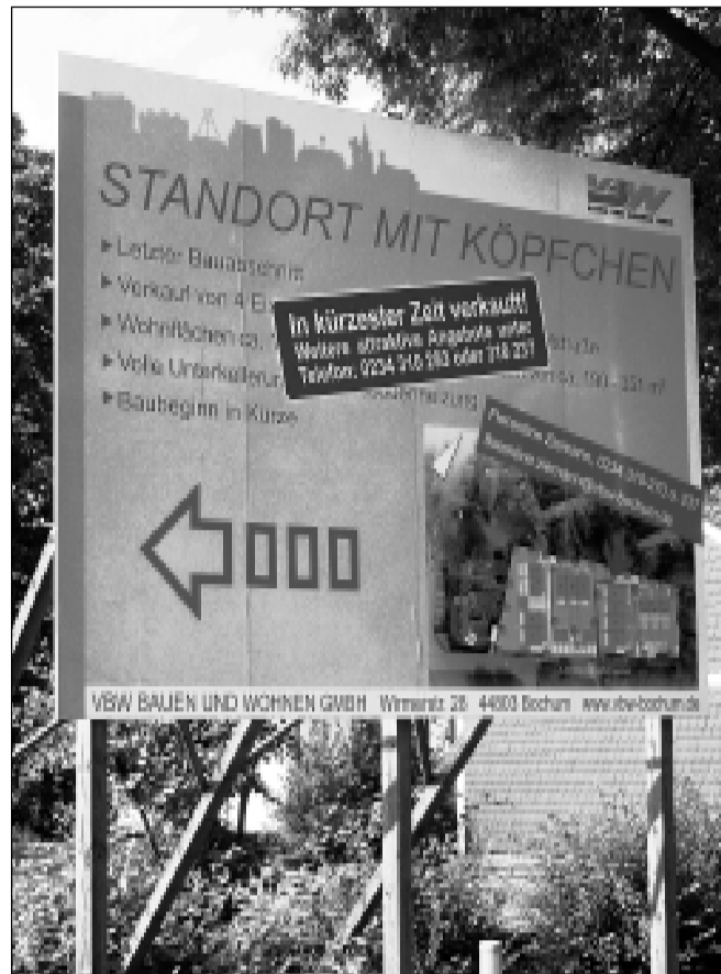
Bauschild VBW: Bau von Eigentumswohnung

Trotz dieser Kritikpunkte liefert die Studie zahlreiche Ansatzpunkte zu Fragen der Armutsentwicklung, der Wohnungssituationen und der Wohnungs- und Stadtentwicklungspolitik.