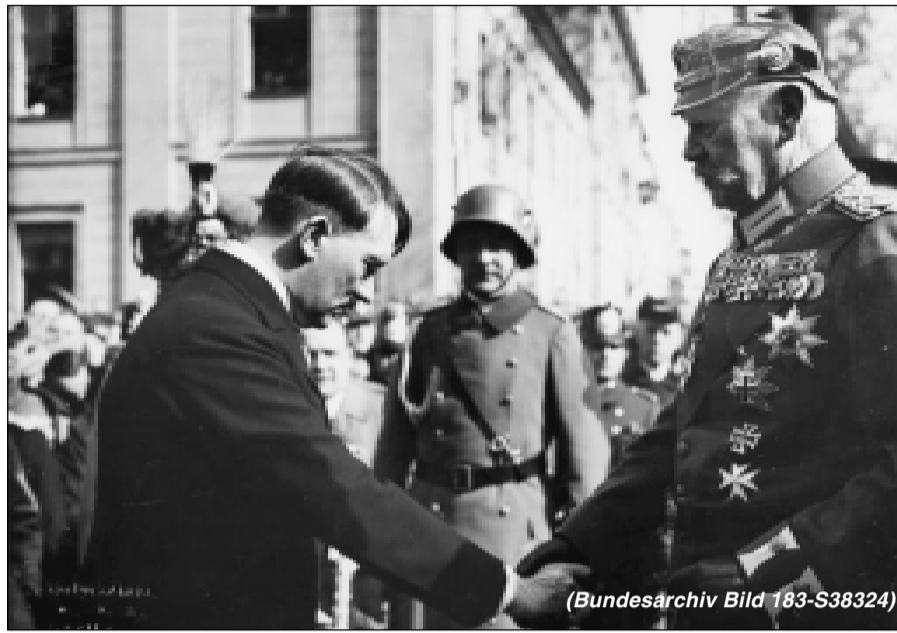
Während Adolf Hitler dieses „Recht“ 1984 aberkannt wurde, besteht es für seinen Steigbügelhalter bis heute.

Bochum gehört zu den Städten, die als erste Paul von Hindenburg zum Ehrenbürger ernannten. Seit 1917, zu seinem 70. Geburtstag, zählt er somit zu den 13 Personen, die Ehrenbürger der Stadt Bochum sind.