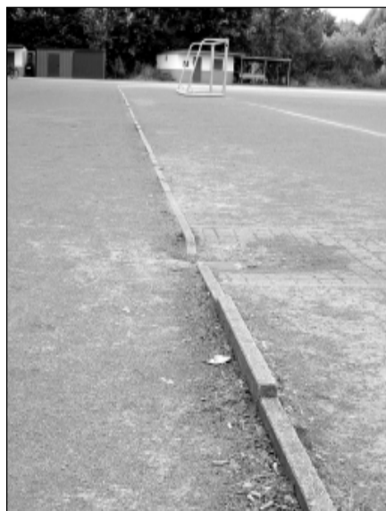
Stolperkanten mit hoher Verletzungsgefahr